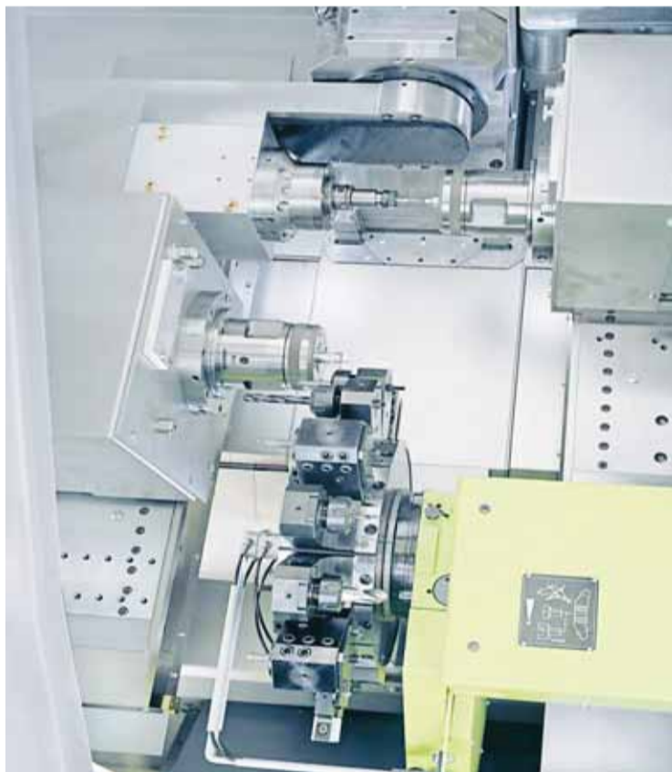
Benzinger Take 5 , kompakt 5 axlig svarv

Benzinger fleroperationsmaskiner levereras till nästan alla industrisektorer, t.ex. den optiska industrin, elektronik, allmän maskin verkstads-, lager-och kuggslipningsteknik, medicin och tandvårdsindustri, rymdteknik och kontrollsystem, ytteknik samt smycke- och klock- tillverkningsindustrin. Alla maskiner finns i flera varianter och med olika automationskomponenter för att passa kundernas krav, de är byggda och anpassas individuellt.